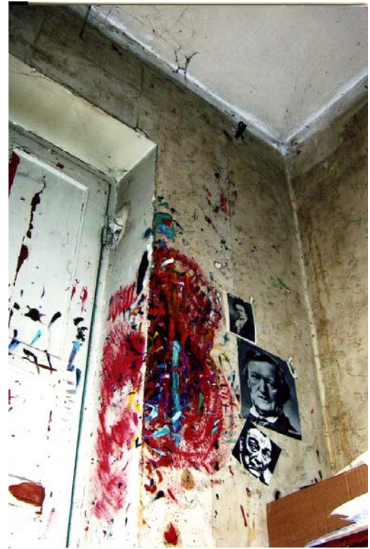
Wallpaper that speaks of protection of national heritage that features Javad's portrait, Baku, 2006