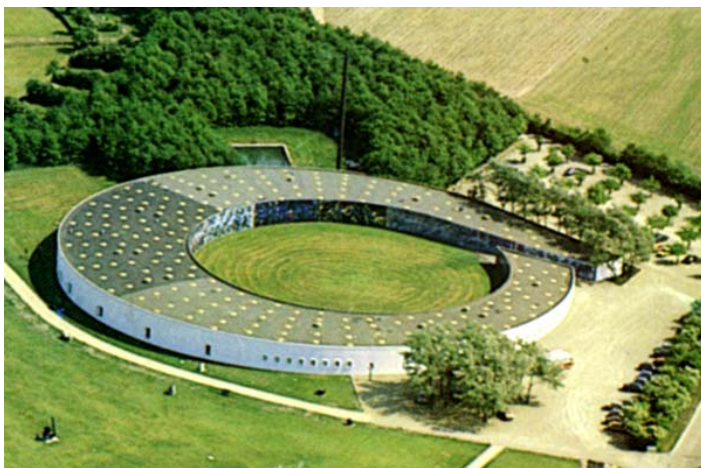
Herning Art Museum where Javad's exposition took place